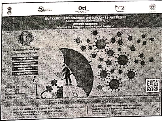
Launch Poster 1.jpg 2455K